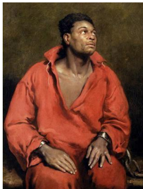
L'esclave captif - J-P Simpson - 1827

100 actes mentionnent également l'origine géographique des esclaves baptisés, dont la répartition est la suivante :