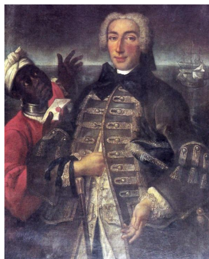
Officier de marine et son esclave Anonyme – XVIII e