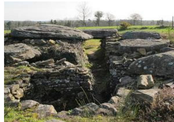
Cairn de Larcust

L'étonnant site préhistorique du Cairn de Larcust en Colpo a suscité un grand intérêt avant que l'on se