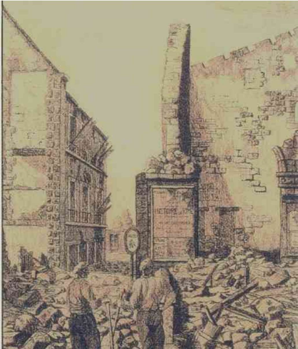
Les ruines du théâtre, Rue de la Comédie, 1943 ( Rivallain )

Des décennies sont passées et c'est ainsi que de nombreux Lorientais de naissance ou de passage, insoucieux des problèmes budgétaires ou artistiques de la Ville et des comédiens, spectateurs inconditionnels ou occasionnels du Théâtre vont se trouver propulsés, bon gré, mal gré, de la salle à la scène où ils deviendront acteurs d'une Tragédie aussi violente que réelle. Nous sommes en 1914 !