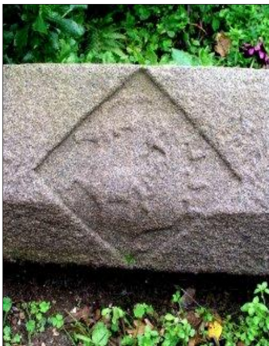
Localisation : Linteau au sol devant la façade ouest du manoir